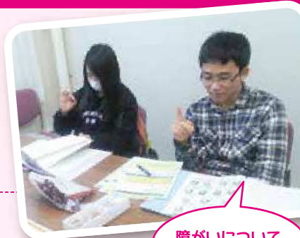
障がいについて 学んだり