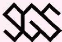
障がい学生サポーターロゴ

SGSは、主に修学における支援にたずさわります。 たとえば、授業において手書きやパソコンによる ノートテイク、車椅子による移動の補助などです。 福井大学に通うすべての学生が、大学での学びの楽 しさや人と人とのつながりの大切さを感じるこ とができるキャンパスづくりに取り組んでいます！